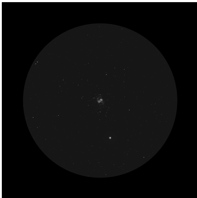
Nagler 22mm (98x - 50' - 4.7mm)

Datos de la región del cielo en el momento de la observación ..... SQM-L 21.30 IR -15.0° Temperatura ambiente 16° Datos de la noche..... Alt sol: -58.0° Alt luna: -32.3° Datos del objeto..... Alt: 72.3° Az: 35.4° Telescopio..... Stargate 18"