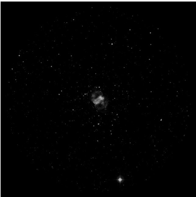
Ethos 10mm (216x - 27' - 2.1mm)

Datos de la región del cielo en el momento de la observación ..... SQM-L 21.30 IR -15.0° Temperatura ambiente 16° Datos de la noche..... Alt sol: -58.0° Alt luna: -32.3° Datos del objeto..... Alt: 72.3° Az: 35.4° Telescopio..... Stargate 18"