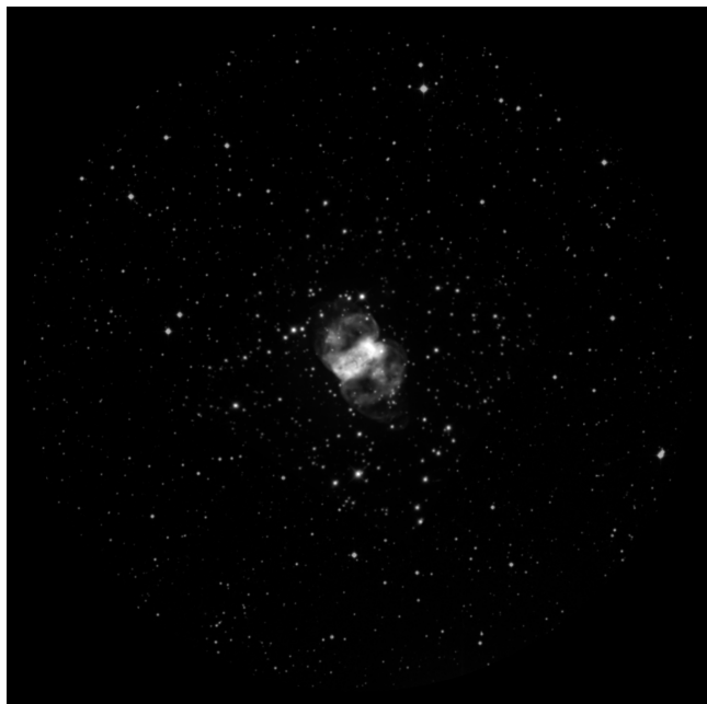
Ethos 8mm (270x - 22' - 1.7mm)

Datos de la región del cielo en el momento de la observación..... SQM-L 21.30 IR -15.0° Temperatura ambiente 16° Datos de la noche..... Alt sol: -58.0° Alt luna: -32.3° Datos del objeto..... Alt: 72.3° Az: 35.4° Telescopio..... Stargate 18"