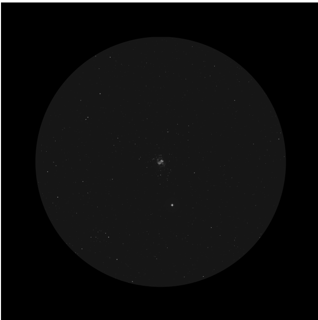
Nagler 31mm (70x - 1° 10' - 6.6mm)

Datos de la región del cielo en el momento de la observación..... SQM-L 21.30 IR -15.0° Temperatura ambiente 16° Datos de la noche..... Alt sol: -58.0° Alt luna: -32.3° Datos del objeto..... Alt: 72.3° Az: 35.4° Telescopio..... Stargate 18"