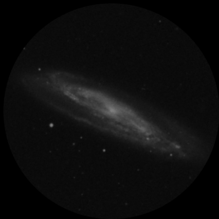
Delos 4.5mm (480x - 9' - 1mm)

Datos de la región del cielo en el momento de la observación..... SQM-L 21.5 IR -17° Temperatura ambiente 15° Datos de la noche ..... Alt sol: -29,1° Alt luna: -37,5° Datos del objeto ..... Alt: 41.8° Az: 254,7° Telescopio ..... Stargate 18"