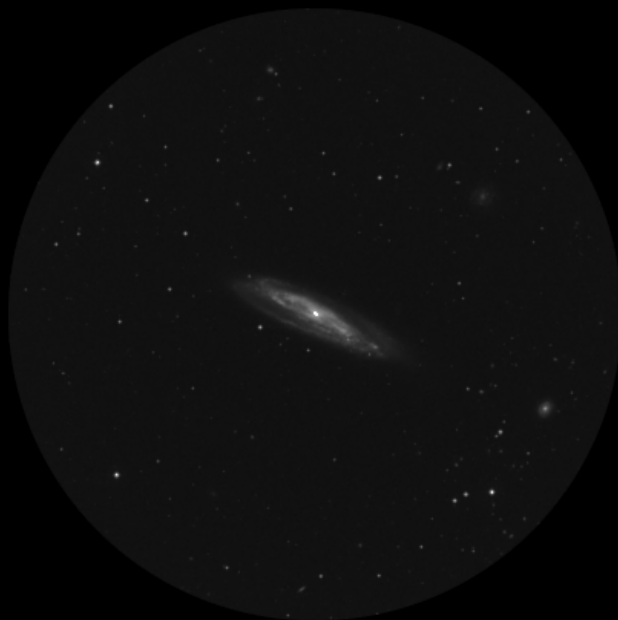
Ethos 10mm (216x - 27' - 2.1mm)

Qué maravilla poder pasar a este ocular. Todo lo que he visto anteriormente queda confirmado. Pero es que voy más allá, diría que la galaxia aparece a mi imaginación como una “galaxia de Andrómeda” en pequeñito. Esa imagen que uno tiene, en cielos oscuros de la galaxia de Andrómeda dónde el núcleo está encerrado en una nubosidad brillante, muy brillante para luego terminar rodeado por un brazo en el que distingues claramente la banda de polvo que se muestra como una zona más oscura que el resto de la galaxia pero sin llegar a ser tan oscuro como el fondo de cielo. Esa es la mismísima imagen que estoy viendo pero, sin embargo, a un tamaño mucho menor. Pero es simple y sencillamente espectacular. Me digo a mí mismo que es mejor incluso que cualquier fotografía porque lo estoy viendo en vivo y en directo por mis propios ojos. La sensación de realidad al observar por